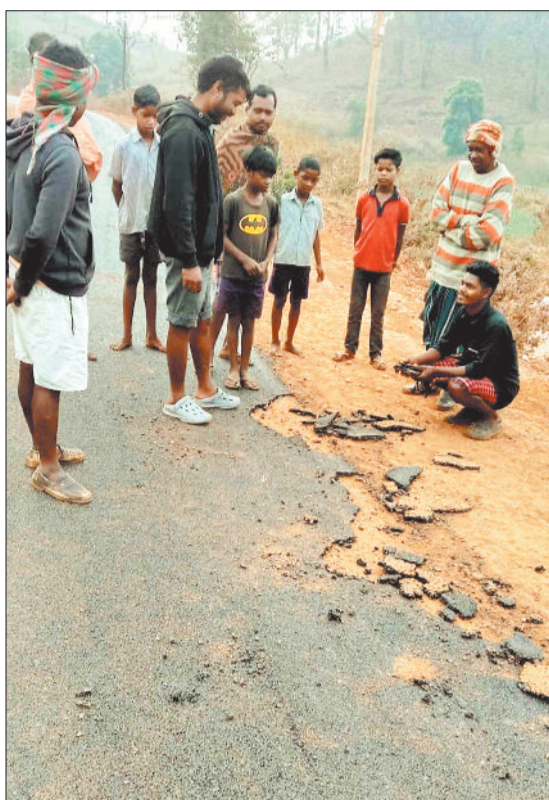
नवनिर्मित सड़क का डामर उखाड़ते ग्रामीण।

विशेष संरक्षित पण्डो एवं कोरवा समुदाय के लोगों को विकास की मुख्यधारा से जोड़ने के उद्देश्य से शासन ने प्रधानमंत्री जनमन योजना के तहत सड़क निर्माण की र-वी कृ ति प्रदान की है। ठे के दा र के ड क निर्माण में विभाग द्वारा निर्धारित गुणवत्ता का पालन नहीं करने से बनने के साथ ही सड़क उखड़ने लगी है। क्षेत्र के ग्रामीणों ने ठेकेदार पर मनमानी निर्माण करने का आरोप लगाया है। विशेष संरक्षित जनजाति पहाड़ी कोरवा एवं पण्डो समुदाय को विकास की मुख्यधारा से जोड़ने शासन ने पीएम जनमन योजना अंतर्गत ग्राम पंचायत असकरा से मडवा सड़क एवं ग्राम पंचायत कुनिया से भुसाखोल तक प्रधानमंत्री ग्रामीण सड़क योजना के तहत जनमन सड़क निर्माण की स्वीकृति प्रदान की है। ठेकेदारों ने सड़क का निर्माण भी प्रारंभ कर दिया है लेकिन गुणवत्ताही निर्माण होने के कारण पेंडेंट चलने के भी सड़क की गिटी उखड़ रही है। दस दिनों पूर्व