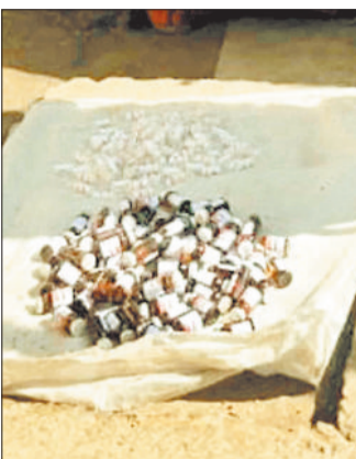
जब्त नशीले इंजेक्शन।